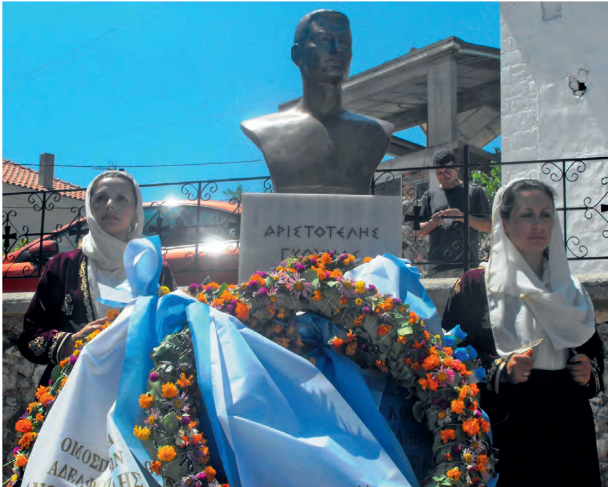
Μνημείο στην γενέτριά του Αριστοτέλη. Αναγράφει εφονευθεί υπερασπιζόμενος την μητρική του γλώσσα.