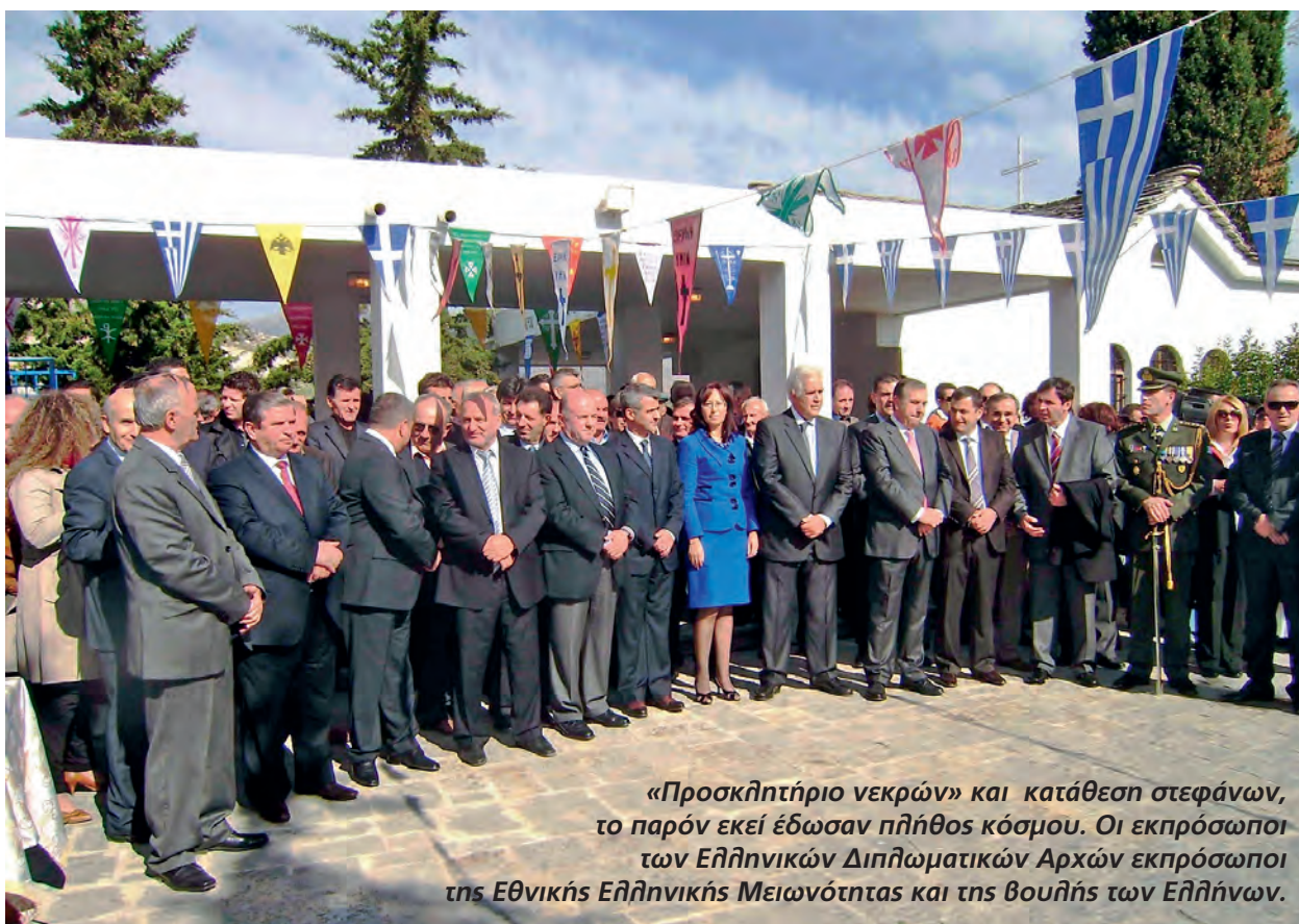
«Προσκλητήριο νεκρών» και κατάθεση στεφάνων, το παρόν εκεί έδωσαν πλήθος κόσμου. Οι εκπρόσωποι των Ελληνικών Διπλωματικών Αρχών εκπρόσωποι της Εθνικής Ελληνικής Μειωνότητας και της βουλής των Ελλήνων.

Και έχει και άλλους συμβολισμούς η τοποθεσία αυτή του ενταφιασμού. Ότι έπεσαν και για την αποκατάσταση μιας ιστορικής αδικίας που έγινε με μας εδώ. Ότι έπεσαν επιπλέον όχι μόνο για την ελευθερία της Ελλάδας αλλά και για την αξιοπρέπεια και άλλων λαών της περιοχής. Για την αξι-