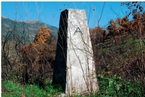
Η Πυραμίδα 24 στα ελληνο-αλβανικά σύνορα.