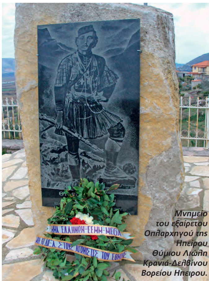
Μνημείο του εξάιρετου Οπληρχηγού της Ηπείρου Θύμιου Λιώλη Κρανιά-Δελθίνου Βορείου Ηπείρου.

Καταπηκτική είναι και η αγιογραφία πού αναπτύχθηκε στο χώρο της Β. Ηπείρου. Οι αρχαιότερες αγιογραφίες χρονολογούνται από τον 12ο αι. (Παναγία Μπόρια Κορυτσάς). Οι αγιογράφοι εδώ ακολουθούν πιστά την βυζαντινή τεχνολογία. Σημαντικότεροι αναδείχθηκαν ο Ονούφριος και ο γιός του Νικόλαος (16ος αι.) που ιστορίσαν Ναούς στο Μπεράτι αλλά και την Καστοριά. Άλλοι αξιόλογοι αγιογράφοι ήταν ο Ονούφριος Κυπριώτης (17ος αι.) και ο Δαβίδ από τη Σελενίτσα (18ος αι.). Ας σημειωθεί ότι όλες οι επιγραφές είναι στην Ελληνική γλώσσα. Το ενιαίο της τέχνης της Β. Ηπείρου με τη Νότια Ήπειρο και τμημάτων αυτών του Ελληνισμού. Στα χρόνια της παρακμής της Βυζαντινής Αυτοκρατορίας δημιουργείται στην ενιαία Ήπειρο το «Δεσποτάτο της Ηπείρου» πού έφτανε από την Άρτα ως το Δυρράχιο. Από το 1449 η Ήπειρος καταλαμβάνεται από τους Τούρ-