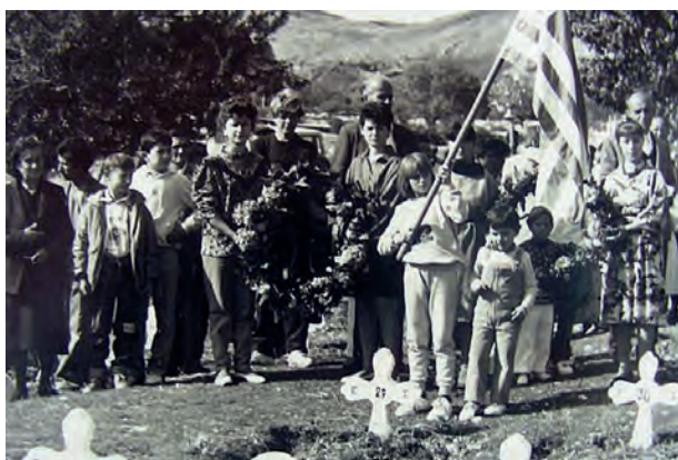
Βουλιράτι 1991. Μετά την πτώση του Κομμουνισμού Βορειοπειρώτες τιμούν για πρώτη φορά τους ήρωες του '40

συγκυριών γλώσσα της οριοθέτησης των συνόρων... Τα ονόματα αυτών των πεσόντων ελλήνων στρατιωτικών όταν άρχισε πλέον η αντεπίθεση επί των εισβολέων Ιταλών, αφού η άμυνα στη γραμμή του Καληπακίου είχε αποδώσει πλέον, όπως μπορούσαμε να τα συλλέξουμε απ' τον κατάλογο που είχε το 1996 δημοσιεύσει η «Καθημερινή», τα δημοσιεύουμε πιο κάτω. Σαν ένα μνημόσυνο απλό. Έστω και για να μην μνημονεύονται πλέον ως άγνωστος έλληνας στρατιωτικός. Ή και για να παρακινήσουμε εάν υπάρχουν συγγενείς που τους ψάχνουν... Γιατί το αξίζουν!