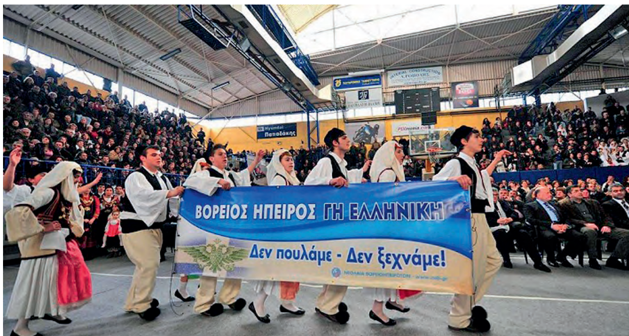
Βορειοηπειρωτικό αντάμωμα στο γήπεδο του Σπóρτινγκ Αθήνα 23 Μαρτίου 2012.

Ο ρόλος των Αθηνών περιορίζεται στο να ενθαρρύνει τη συγκρότηση ενός ενιαίου, ισχυρού μετώπου