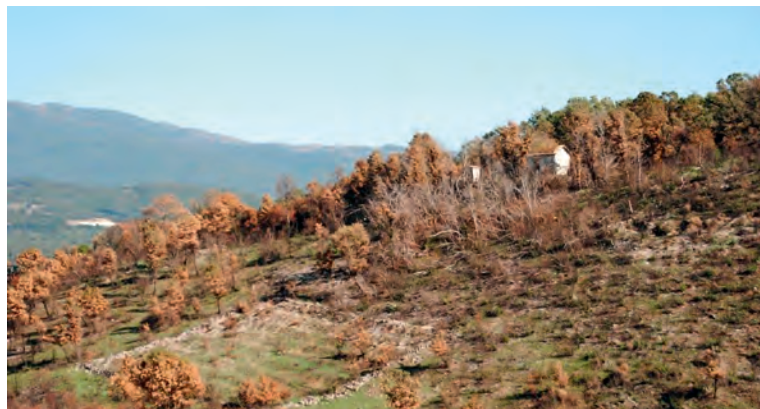
Πάνω από το νεκροταφείο το ελληνικό φυλάκιο.

Δίπλα ακριβώς στην Πυραμίδα υπ. αρ. 24, απ' τη σειρά των πυραμίδων που οριοθετούν τα χερσαία σύνορα της Ελλάδας με την αλβανική επικράτεια, υπάρχει εγκαταλειμμένο νεκροταφείο. Όχι απλώς τόπος ενταφίασης αλλά σχεδόν κανονικό νεκροταφείο. Πληροφορίες που είχαμε συλλέξει και περισσότερο ομοιότητες ηλικιωμένων ανθρώπων οδήγησαν την πορεία μας εκεί στα στενά του Μπογάζι,