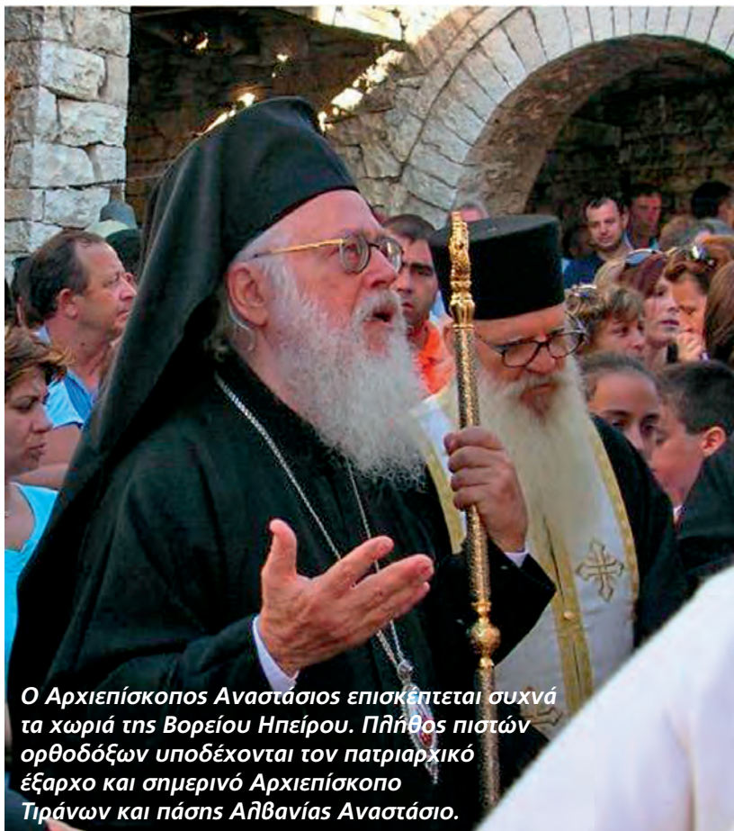
Ο Αρχιεπίσκοπος Αναστάσιος επισκέπτεται συχνά τα χωριά της Βορείου Ηπείρου. Πλήθος πιστών ορθοδόξων υποδέχονται τον πατριарχικό έξαρχο και σημερινό Αρχιεπίσκοπο Τυράνων και πάσης Αθβανίας Αναστάσιο.