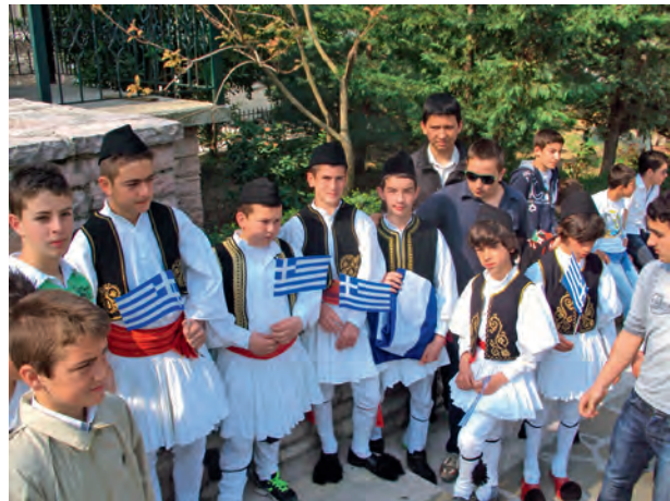
Δερβιτσάνι αργυροκάστρου εκδηλώσεις για την επετειο του ΟΧΙ. Η πομπή κατευθύνεται προς το κέντρο του χωριού.

Μετά από 18 χρόνια «δημοκρατίας» το ζήτημα μιας καλύτερης παιδείας για τους Βορειοηπειρώτες στα πατρογονικά τους εδάφη παραμένει στις καλένδες της Ελληνικής πολιτικής πραγματικότητας και οι όποιες υποσχέσεις και σπασμωδικές κινήσεις δεν είναι παρά μια «γλυκόπιρρη καραμέλλα» που προσφέρεται στον Ελληνισμό της Αλβανίας σε κάθε επίσκεψη υπουργών, βουλευτών, πολιτικών και στελεχών της Ελληνικής Πολιτείας. Οι ελάχιστες προσπάθειες που έχουν γίνει μέχρι σήμερα δεν έλυσαν ουσιαστικά κανένα πρόβλημα και ούτε θα επιλύσουν αν δεν τεθούν σε μια νέα βάση: την επέκταση του Ελληνικού Εθνικού Συστήματος Παιδείας στην Βόρειο Ήπειρο με το άνοιγμα σχολείων στα πρότυπα της εκπαίδευσης ομογενών ανά την υφήλιο.