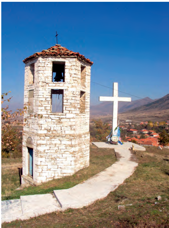
Μνημείο πεσόντων του Ελληνοϊταλικού πολέμου. Μπομποστίτσα Κορήτσας