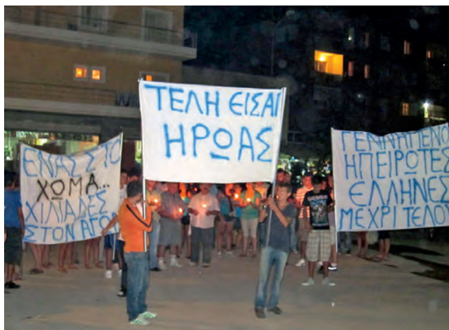
Διαμαρτυρία στους δρόμους της χειμάρας.

Αμέσως μετά το πρώτο συναπάντημα οι θρασύδειλοι δολοφόνιοι αποχώρησαν. Ειδάλλως αν υπήρχε συμπλοκή, είναι βέβαιο ότι οι Αλβανοί θα είχαν λάβει το μάθημα που τους ταίριαζε. Στη συνέχεια ο Αριστοτέλης αποχώρησε για λόγους οικογενειακούς με τη μηχανή του. Όμως τα ενεργούμενα της τρομοκρατίας του Βορειοηπειρωτικού Ελληνισμού είχαν στήσει κατέρι στον ηρωικό Βορειοηπειρώτη. Με τη χρήση αυτοκινήτου επιτέθηκαν επανειλημμένα περνώντας επάνω από το σώμα του Εθνομάρτυρα. Τα χάρδια της αλβανικής «δικαιοσύνης» δεν δικαιώσαν όπως έπρεπε το χαμό του αδελφού μας, μοιλονότι ο Μπερίσα ομοιό-