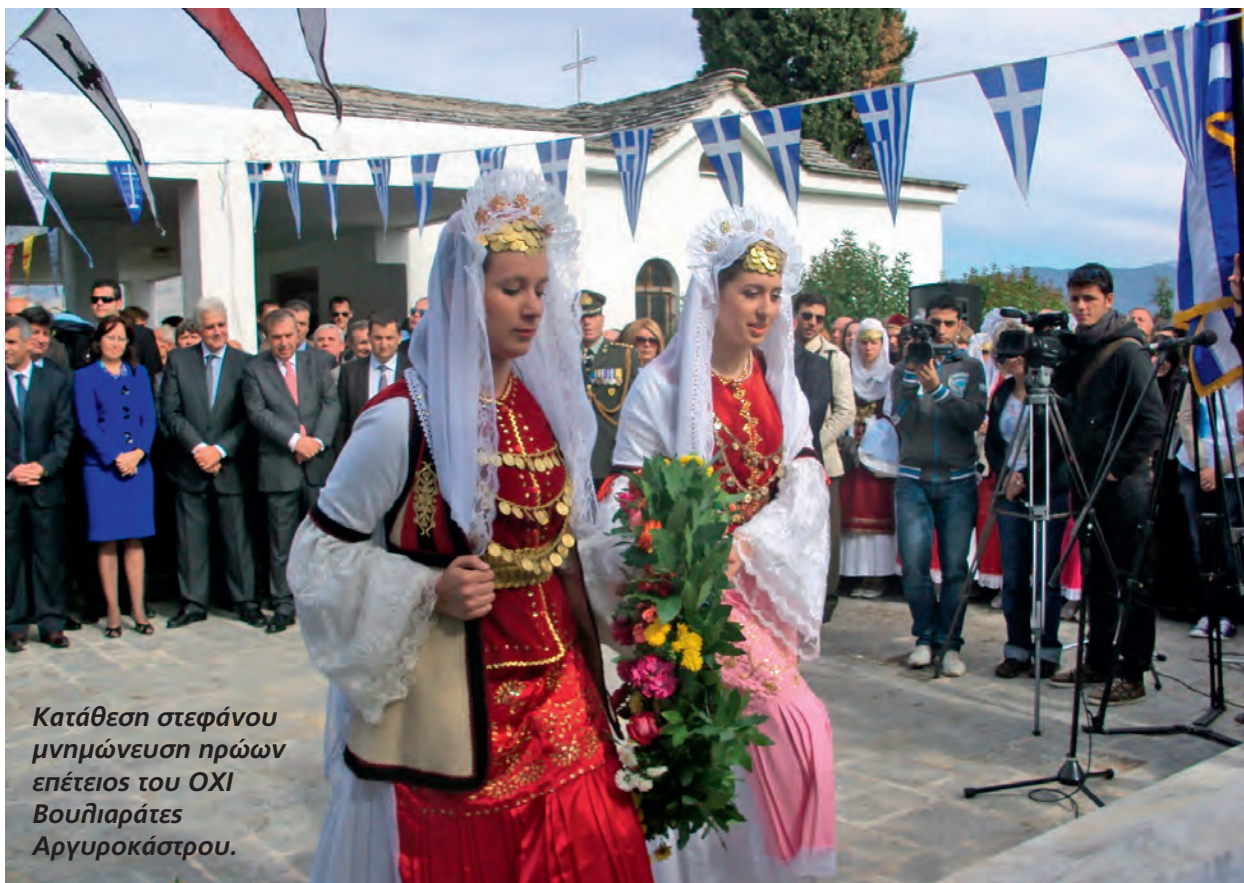
Κατάθεση στεφάνου μνημόνευση ηρώων επέτειος του ΟΧΙ Βουλιάρτες Αργυροκάστρου.

απέναντι απ' τους Γεωργουτσάτες και ανάμεσα στο χωριό Ραντάτες και Άνω Επισκοπή. Εκεί όπου σταματάει το όρος Μπουρέτο και που στο βάθος είναι το πρώτο χωριό της ελληνικής επικράτειας, το Ορεινό. Εγκαταλειμμένοι στη σιωπή τους, είναι ίσως... απ' τους πρώτους ήρωες που έπεσαν στις μάχες με τους Ιταλούς σε «ξένο» έδαφος. Διότι ξένο δεν είναι, απλώς για την αυστηρή των