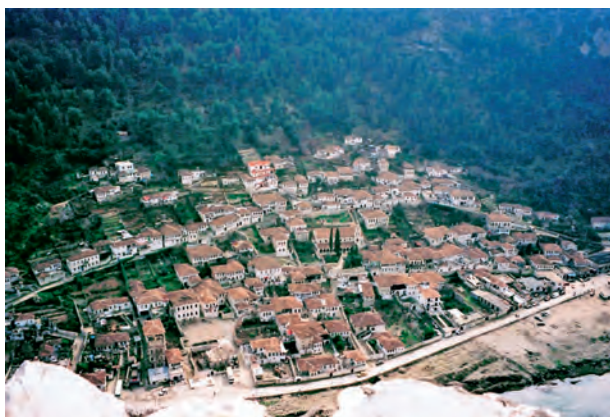
ΒΕΡΑΤΙΟΝ - ΒΥΖΑΝΤΙΝΗ ΣΥΝΟΙΚΙΑ