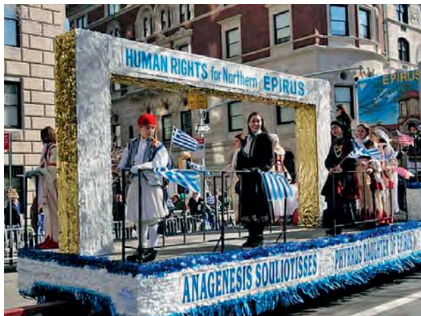
Οι Έλληνες Ομογενείς στην Αμερική τιμούν ιδιαίτερα την Βόρειο Ηπειρο. Παρέλαση για τον εορτασμό της 25ης Μαρτίου στην Βοστώνη.

Μια σειρά γεγονότων στη Βόρειο Ήπειρο, μεταξύ αυτών η διενέργεια της απογραφής στην Αλβανία και η καταδίκη του Ναούμ Ντίσιου, τους τελευταίους μήνες έρχεται να λειτουργήσει ως θλιβερή υπόμνηση για την πολιτική πληθυσμιακής αλλοίωσης εις βάρος του βορειοηπειρωτικού Ελληνισμού στη γενέθλια γη του. Η πολιτική αυτή, πάγια αλβανική στόχευση, επιβραβεύεται από το γεγονός της έλλειψης σαφούς και