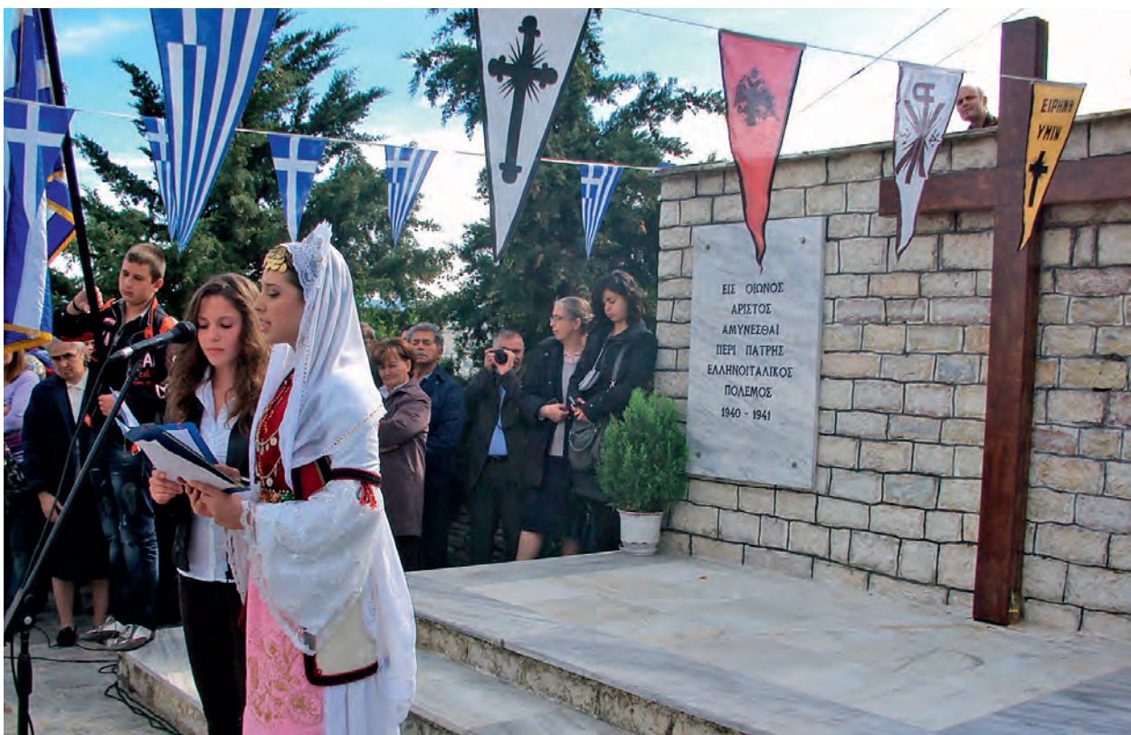
Οι Βορειοπειρώτες τιμούν, μόνο όπως οι ίδιοι ξέρουν, την επέτειο του «ΟΧΙ» 70 χρόνια μετά, στον τόπο που γράφτηκε κατά το μεγαλύτερο μέρος του το Έπος του 1940.

στο χώρο της ελληνικής μειονότητας, μη προσφέροντας ουσιαστική χείρα βοήθειας, εκτός από τις μονότονες διαβεβαιώσεις, οι οποίες προκαλούν υπνηλία ακόμη και σε αυτούς που τις γράφουν. Το λεγόμενο Εθνικό Κέντρο κρύβεται πίσω από ανήμπορους γέροντες και ερειπωμένα χωριά.